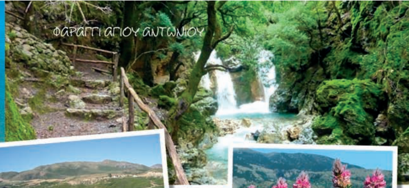
ΦΑΡΑΓΓΙ ΑΓΙΟΥ ΑΝΤΩΝΙΟΥ

■ Η εκδρομή περιλαμβάνει μετάβαση στο Ελαφονήσι, στάση στο Μοναστήρι της Χρυσσοκαλιτίσας, παραμονή στην παραλία και επιστροφή.