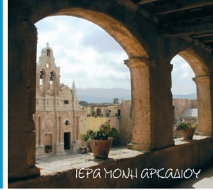
ΙΕΡΑ ΜΟΝΗ ΑΡΚΑΔΙΟΥ

3 Από τους ανθρωπόμορφους βενετσιάνικους πύργους του Μαρουλιά στο Αρκάδι. Ευρωπαϊκό μνημείο Ελευθερίας και στις Μαργαρίτες όπου η παράδοση πλάθεται με πηλό.